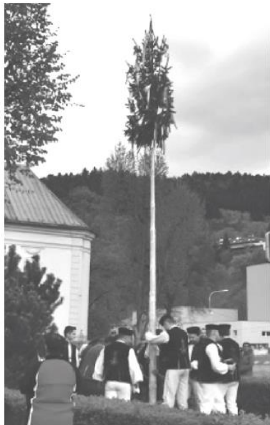
Máj už zdobí naše mesto.

Jednou z tradičných akcií je aj nočný pochod na trase Krompachy – Prešov, ktorého sa aj tento rok zúčastnilo niekoľko