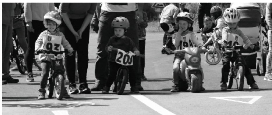
Najmenší účastníci súťaží.