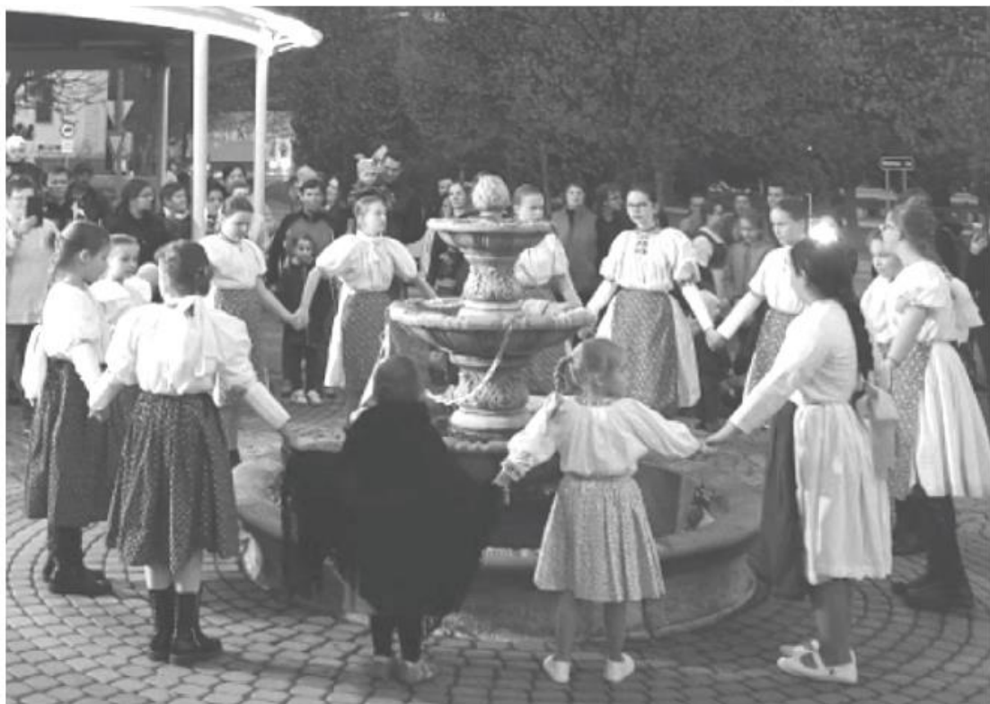
Odomykanie fontán sa stalo v meste tradíciou.