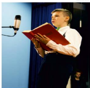
Žiak školy A. Lach.