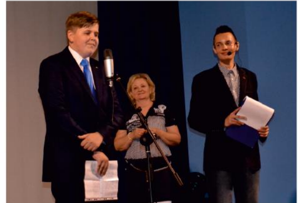
Iniciatívni študenti, ktorí oceňovanie zorganizovali.