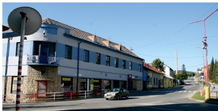
Križovatka pri Jubilejnom dome prejde modernizáciou.