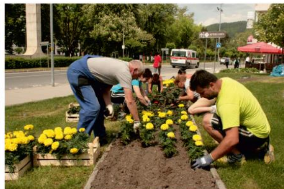
Centrum mesta v týchto dňoch zakvitlo.