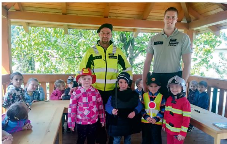
Policajná práca škôlkarov zaujala. Spoločné foto po prednáške.