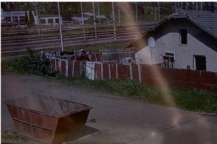
Kontajner na Družstevnej pod drobnohľadom kamery.

a Družstevnej ulice vrecia rozoberajú a robia neporiadok,“ zdôraznil J. Kuna. Mestská polícia preto uvažuje aj o osadení dočasných fotopascí, ktoré by situáciu na spomínaných uliciach pomohli vyriešiť. Mesto v súčasnosti disponuje štyrmi fotopascami. Kamerový systém v našom meste prešiel za ostatných päť rokov výraznými zmenami. Z pôvodných 8 kamier sa rozrástol na 32. S ďalšími 14 kamerami sa uvažuje v rámci projektu, ktorého podporu pred časom deklaroval rezort vnútra. V súčasnosti je aj vzhľadom na aktuálnu politickú situáciu, projekt pozastavený. Najväčší „upgrade“ zaznamenal kamerový systém vlni, odkedy je napojený na vlastnú optickú sieť. (šim)