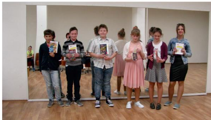
Víťazi v mestskom kole 4.-6. roč.