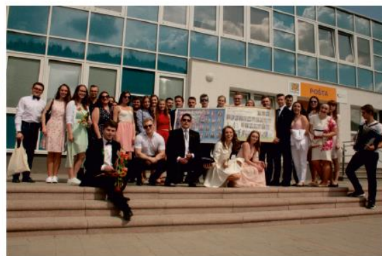
Máj je už tradične späť s maturantami. Gymnazisti.