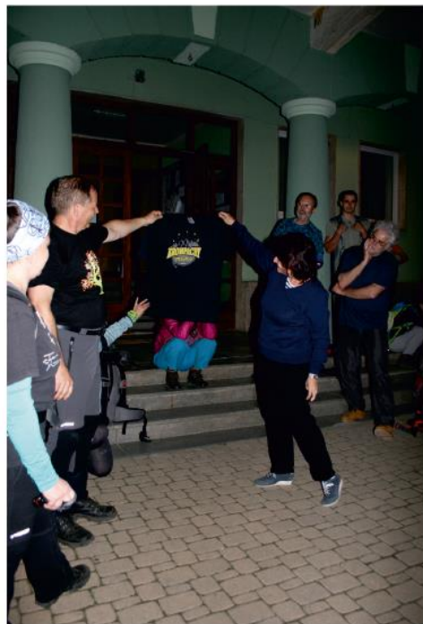
Tričko s nápisom Kropachy dostala aj primátorka mesta.

MESTO KROPACHY MESTSKÝ ŠPORTOVÝ KLUB KROPACHY TURISTICKÝ ODDIEL MŠK KROPACHY