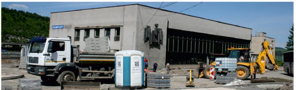
Predstaničný priestor nadobúda nové kontúry.