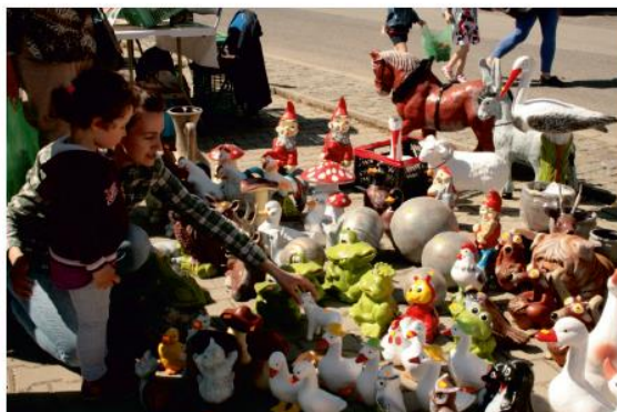
Trh kvetov a zelene ponuka keramiky zaujala najviac deti.