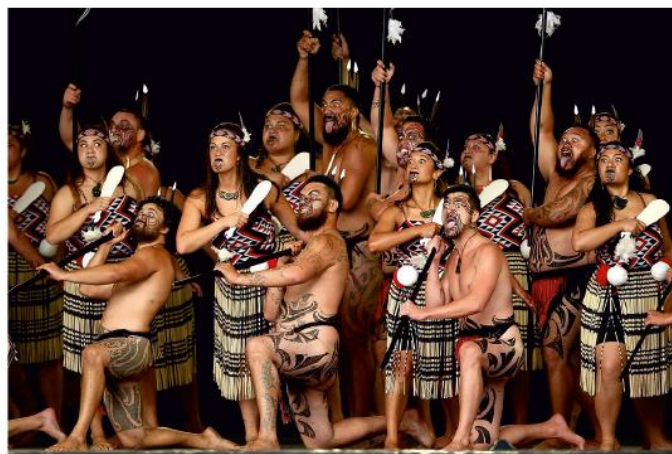
“Bojovníci” v tanci Haka.