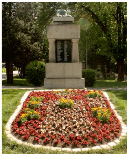
Erb mesta v pestrých farbách kvetov