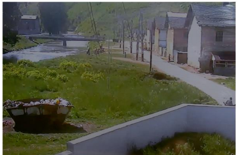
Hornádska ulica je tiež v hľadáčku kamery.