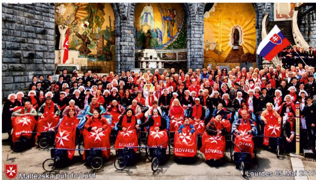
Účastníci púte do Lúrd.