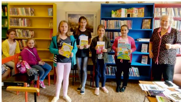
Preberanie cien Zo šufflika.