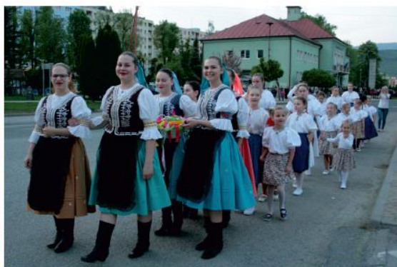
Prvomájová slávnosť s folklóristami.