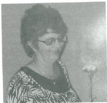
jej pamiatka ostane navždy v našich srdciach

Všetko sa začína, všetko sa končí, maličká roľníčka na kose rojčí. Nikto to nečakal a však sa to stalo, keď niekde vo svete práve dieťa zaplakalo, vyhasol v tom život, milý a láskavý a však za tým životom, srdcia zaplakali. Nebol ešte pripravený, tento život odísť preč, príbuzní tej dušičky stratli na dlho reč. Bola to dáma, ako má byť, keď vošla do triedy, začala nanovo žiť. Práca bol jej koníček, vložila doň srdce a však to srdce dotýklo, je navždy mŕtve. Jej duša však už pokoj má, už žije v nebi, učí malé anjeličky, ako nás vtedy.